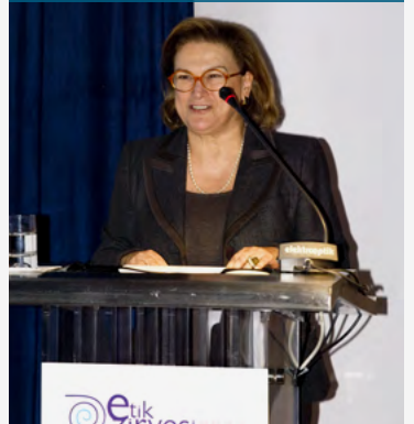
Güler Sabancı Sabancı Holding Chairperson of the Board