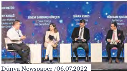
Dünya Newspaper /06.07.2022